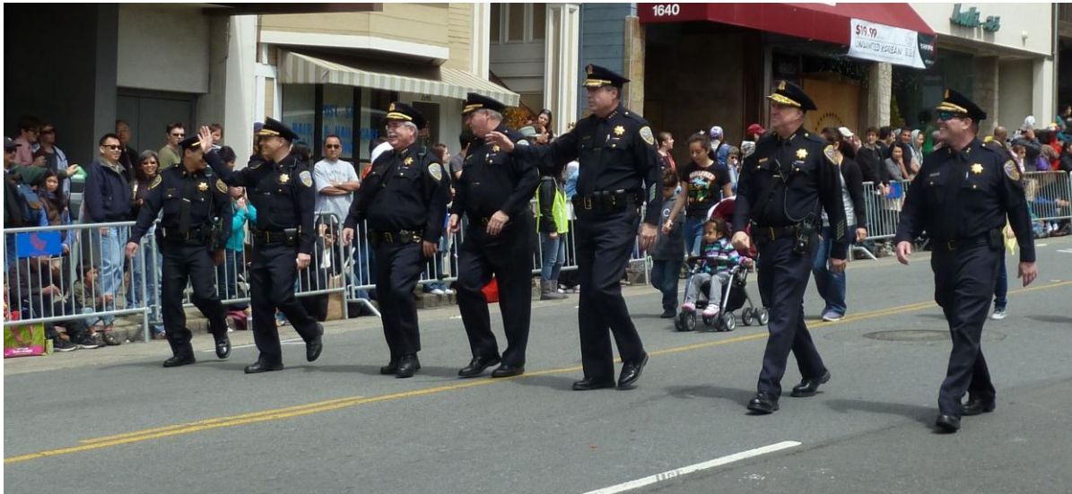
Mitte: Chef der Stadtpolizei San Francisco mit seinem Stab