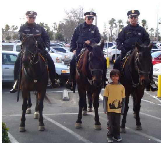
Berittene Polizei in Fresno, Kalifornien