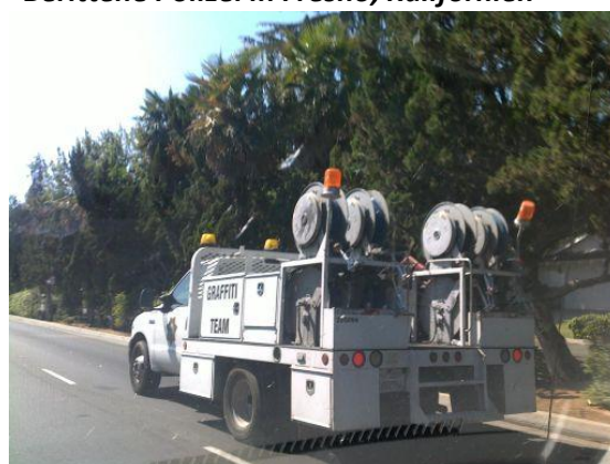
Graffiti-Team der Fresno Polizei